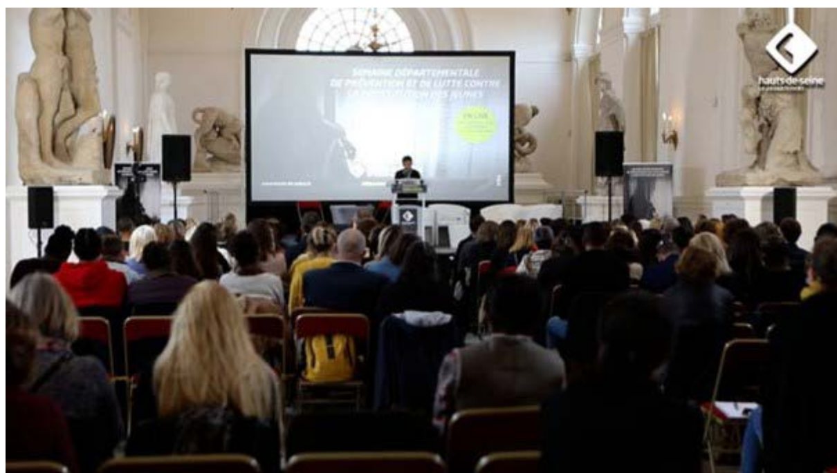
Source : Le département à l'initiative d'une semaine de prévention et de lutte contre la prostitution des jeunes, Départements des Hauts-de-Seine, 2021-11, 1 min 54 sec, en ligne : Accéder à la ressource