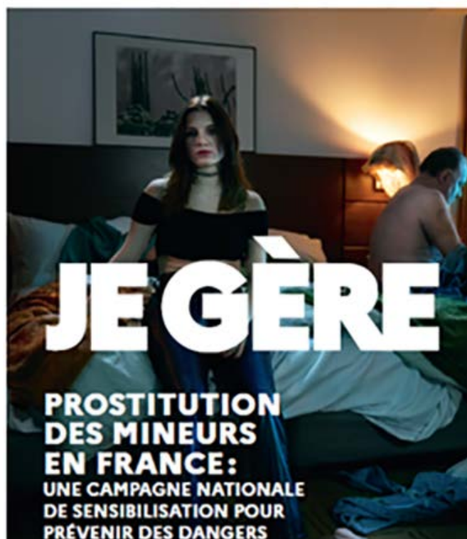
Source : Je gère ! Campagne de protection des mineurs victimes de prostitution, Ministère de la solidarité, 60 sec, 2022-02, en ligne : Accéder à la ressource